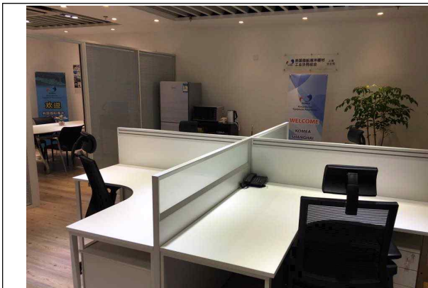
중국 상해 사무실

Laiyifen 1102F, No.1399,Husong Ro, Songjiang Gu, Shanghai, China